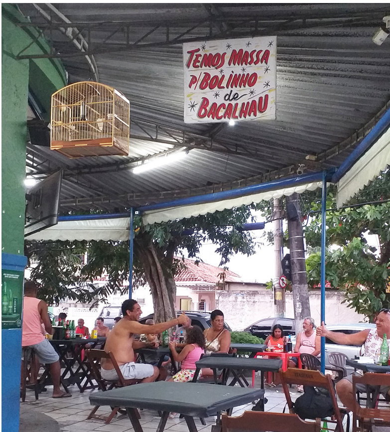
Afeto nas relações sociais suburbanas [Rocha Miranda, 2022]