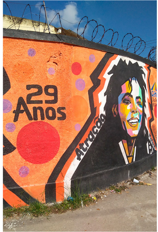
Grafite da turma de bate-bola Atração [Rocha Miranda, 2020]