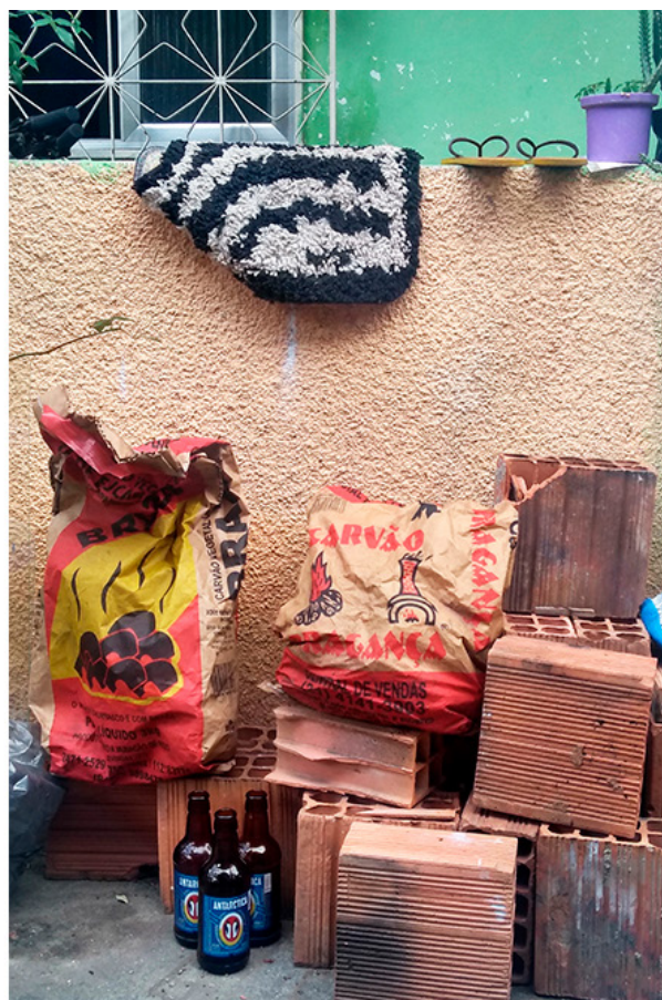
Quintal suburbano [Marechal Hermes, 2018]