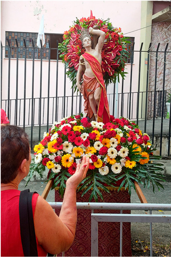
Procissão de São Sebastião [Bento Ribeiro, 2023]